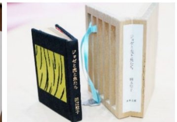
手のひらサイズの豆本