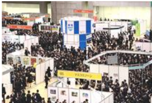
（国内最大級の就職イベント、 キャリアス就活フォーラム）

出社後、お客様や社内連絡事項のメールをチェックし、すぐに返信を行います。そして一日のスケジュールを確認し、優先順位をつけ必要な業務をこなしていきます。イベント会場の下見や先方との打ち合わせ、マニュアル作成など、採用活動の時期に合わせて準備を進めていきます。