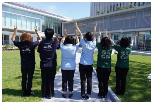
ユニフォームを着用した文化創造館スタッフの皆さま

この取り組みは、地域とのつながりやにぎわいの創出、将来の文化芸術を担う創造力豊かな人材の育成を目的とする文化と学生のまちコラボ企画として、東大阪市文化創造館から大阪樟蔭女子大学に依頼を受けたものです。ユニフォームは、3色の半袖ポロシャツに3種類のデザインがプリントされています。