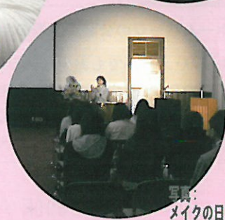
写真: メイクの日昨年度風景

メイクの日は、5月9日 (May.9) を中心に全国で開催されています。 大阪では大阪樟蔭女子大学にて第2回の「メイクの日 In Osaka」を開催します。