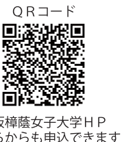
大阪樟蔭女子大学HP こちらからも申込できます

申込み及び問合せ先 大阪樟蔭女子大学 学芸学部 被服学科 樟蔭ファッションセミナー事務局 〒577-8550 東大阪市菱屋西 4-2-26 TEL/FAX：06-6723-8227 E-mail：fashionseminar@osaka-shoin.ac.jp URL:http://www.osaka-shoin.ac.jp