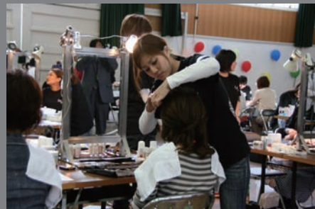
写真：メイクの日 In Osaka