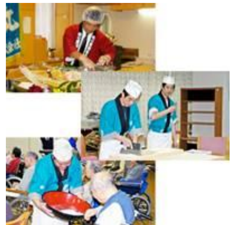
（参加型イベント食）

今はまだチーフ業務に携わることは少なく、できることもまだまだ少ないですが、いずれは一つの事業所のチーフになれるように、様々なことを吸収しながら日々業務に励みたいです。また、私は管理栄養士資格の取得も目指しているため、取得できるよう時間をうまく見つけて勉強を頑張っているところです。