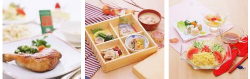
（七草粥、節分、七夕などの行事食の例）

配膳のミスが判明した時、どのように対応すべきか冷静な状況判断ができず、とても後悔しました。ミスが起こらないようにする心掛け、起きてしまった時の対