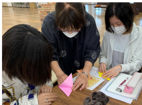
折り鶴の折り方を教わっている様子