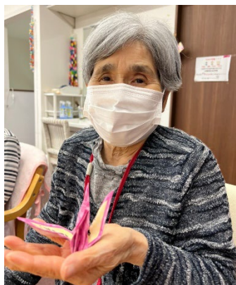
折った折り鶴を手にする利用者さん

※オンラインイベント、ラジオとも、上記の各 URL から過去の内容をご視聴いただけます。