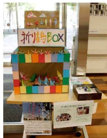
学内の折り鶴回収 BOX