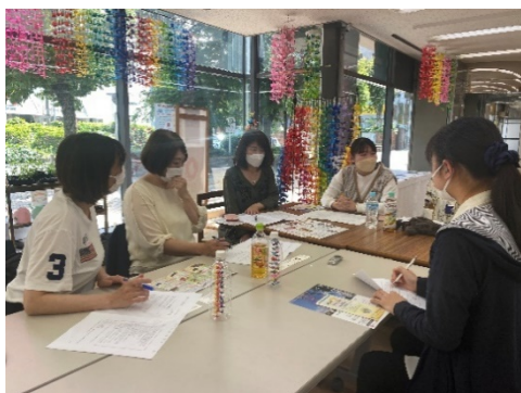
SDGirlsとゆめ伴さんとの打ち合わせの様子