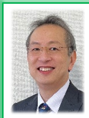
川上 正浩 教授