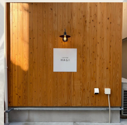
「cuisine HAGI」 @cuisine_hagi