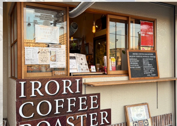
「IRORI COFFEE ROASTER」 @irori-coffee-roaster