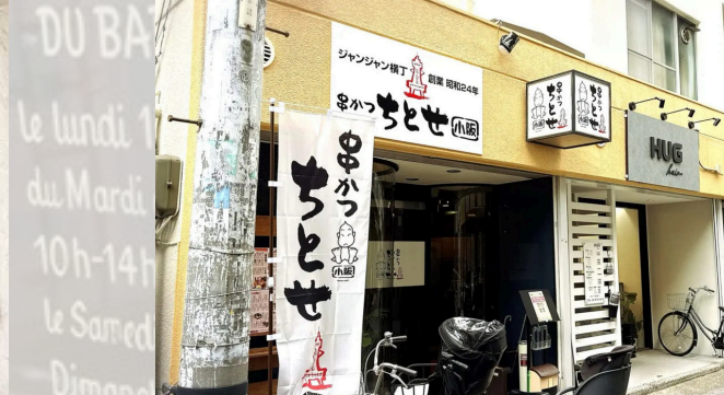
「串カツちとせ小阪店」 @kushikatsu_chitose_kosaka