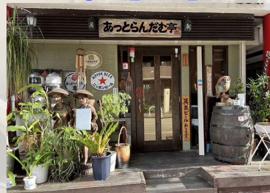
「あっとらんだむ亭」@atsutorandamu