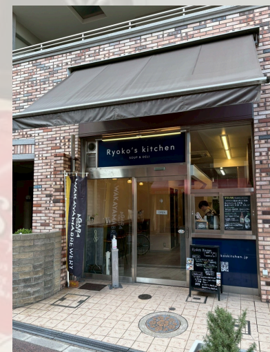
「Ryoko's kitchen」 @ryokoskitchen.kosaka