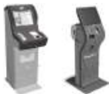
コンビニ店頭端末

ローソン、ミニストップ、ファミリーマート、セイコーマート、 デイリーヤマザキ、ヤマザキデイリーストアで 入学検定料を払い込んでください。